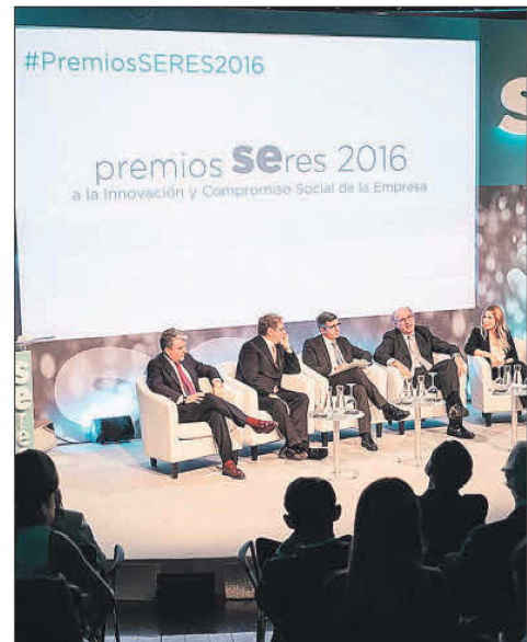
Entrega de los premios de la séptima Edición de la Fundación Seres. EE

La Fundación ha apostado por la innovación social como elemento para afrontar los retos que se